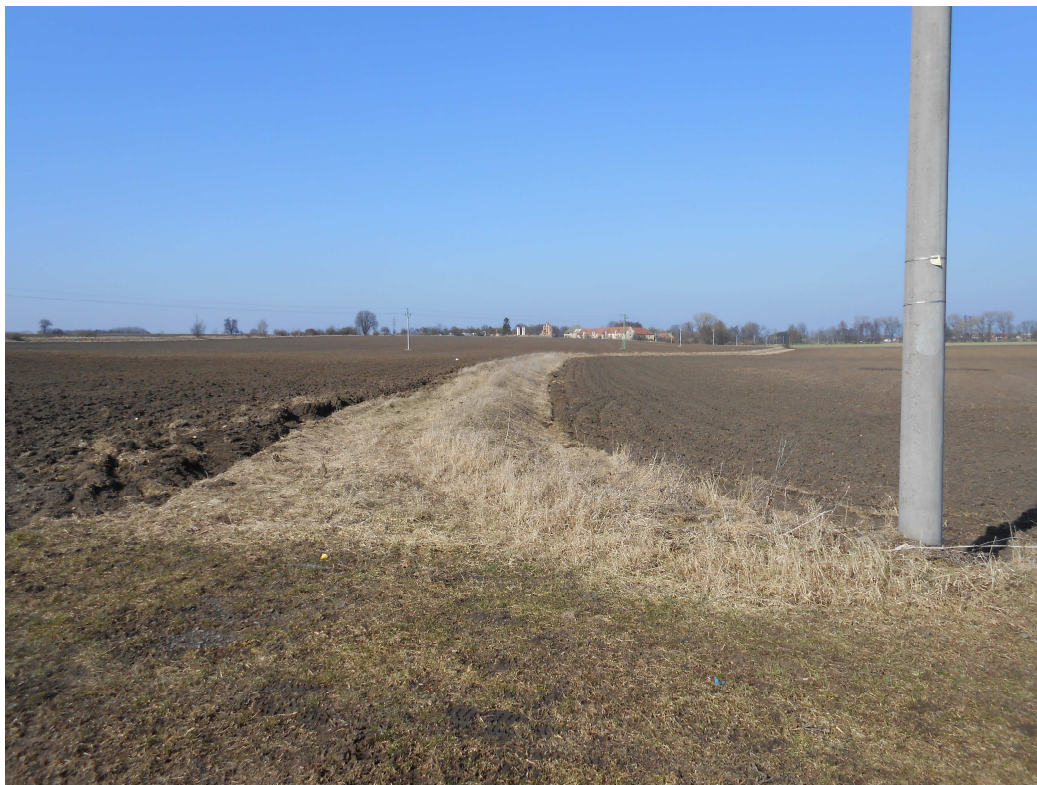
Obr. 101 Polní cesta HC1 – napojení polní cesty HC4