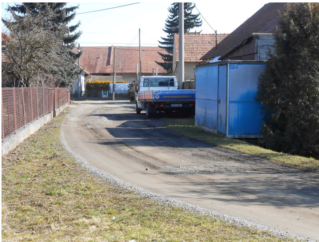
Obr. 98, Polní cesta HC1 – napojení na místní komunikaci v intravilánu