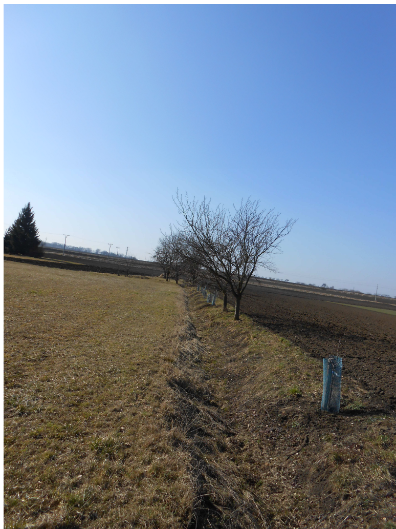
Obr. 94 Příkop P1 – pohled směrem k napojení příkopu P2