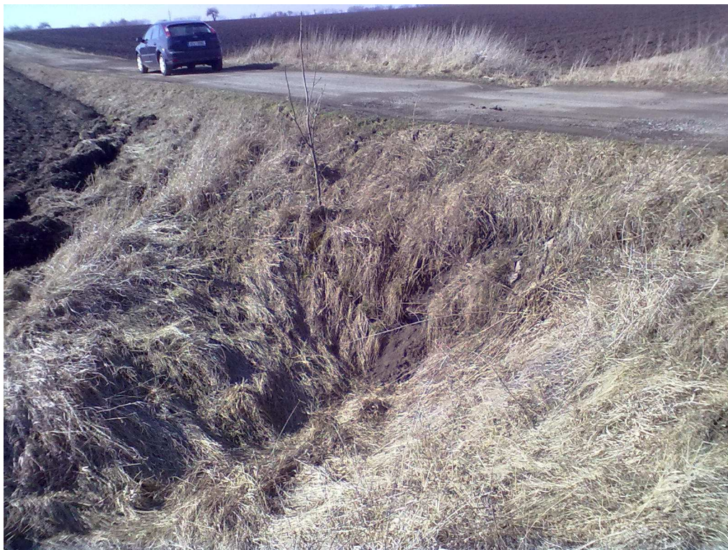
Obr. 144 Polní cesta HC1 – propustek P18