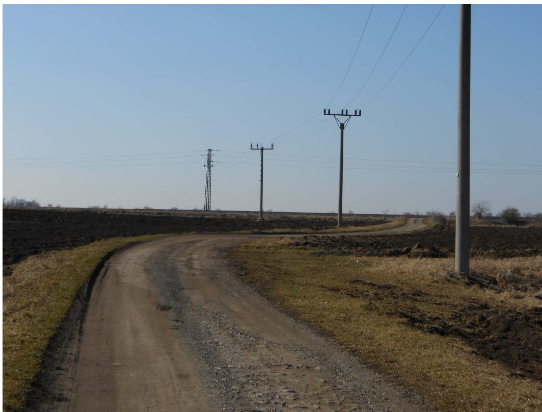
Obr. 100 Polní cesta HC1 – počáteční úsek