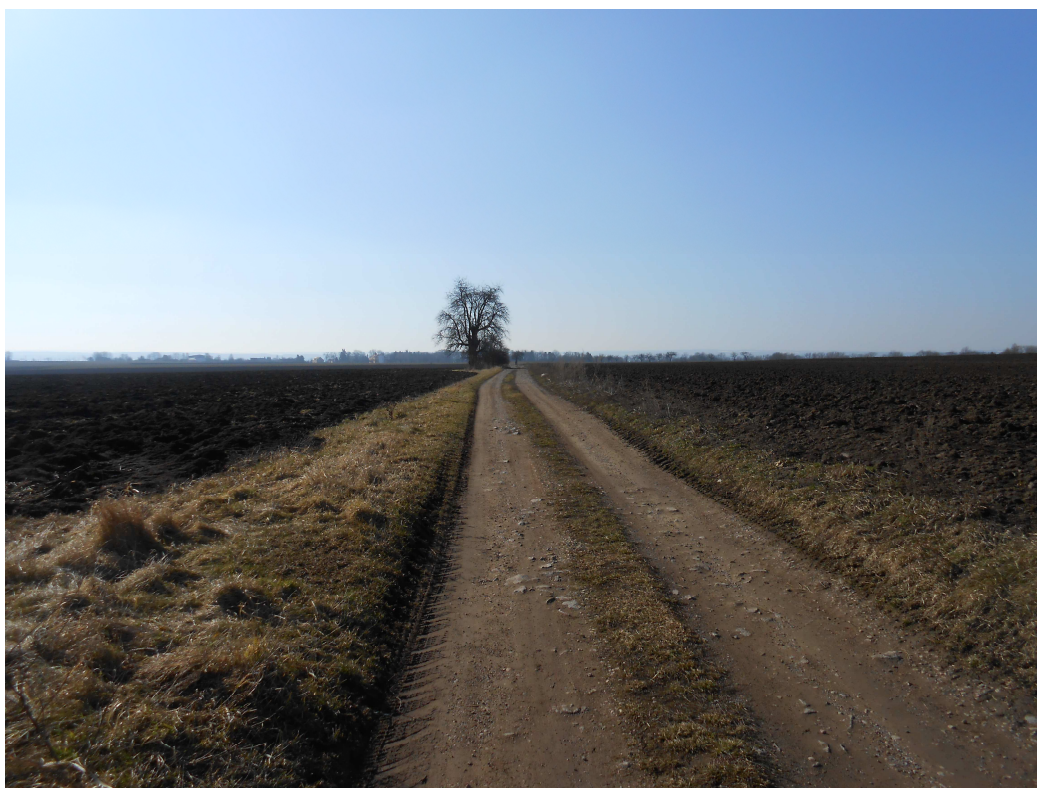
Obr. 10 Polní cesta HC2 – počáteční úsek – pohled od intravilánu Skalice