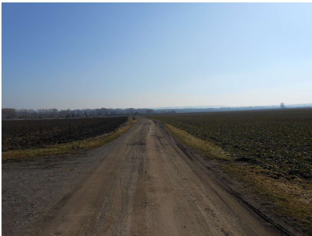
Obr. 2 Polní cesta HC1 – koncová část – napojení HC2