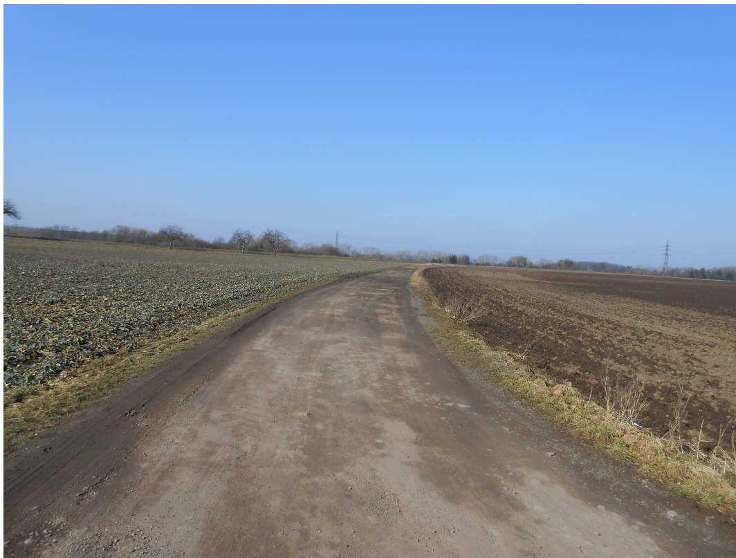
Obr. 1 Polní cesta HC1 – koncová část – katastrální hranice s k.ú. Hrochův Týnec