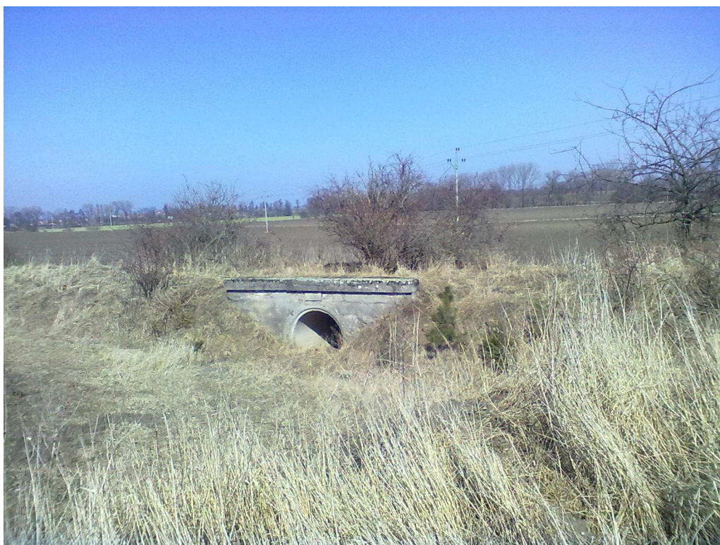
Obr. 140 Polní cesta HC1 – propustek P19