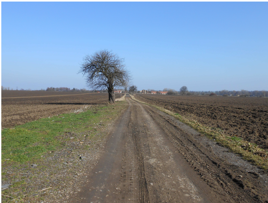
Obr. 9 Polní cesta HC2 – koncová část – napojení na HC1