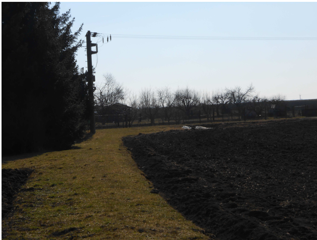
Obr. 97 Příkop P2 – místo odklonu od HC1