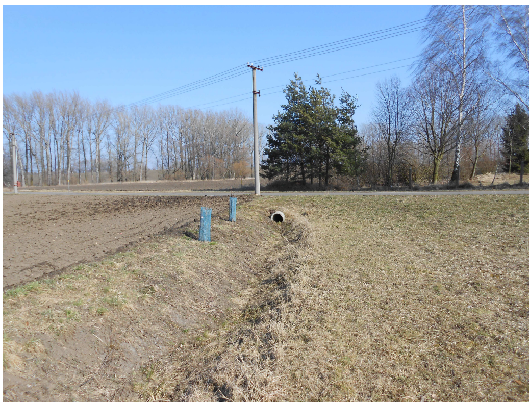
Obr. 102 Příkop P1 – propustek pod silnicí III/3553